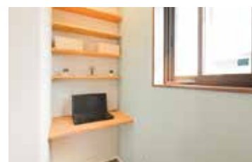
お部屋の一角に設けた書斎コーナーでリモートワークもOK