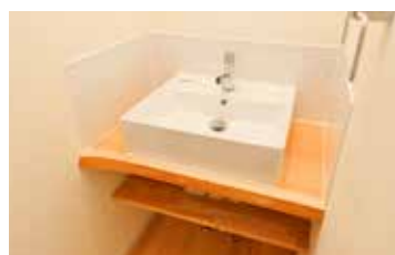
玄関ホール横に手洗いを設置し感染予防対策もバッチリ