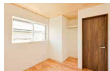
床も天井も天然木仕上げの子供室は木の香りに包まれた優しい空間