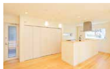
キッチン背面に大型パントリーを設置し、まとめ買いも可能です