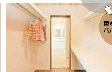
サニタリー～ウォークスルークローゼット～バルコニーが繋がる家事効率UPの間取りで、毎日のお洗濯もラクラク！