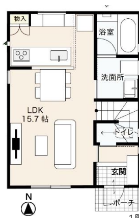
【倉敷本社】 倉敷市堀南 628-12(大高小学校南側)