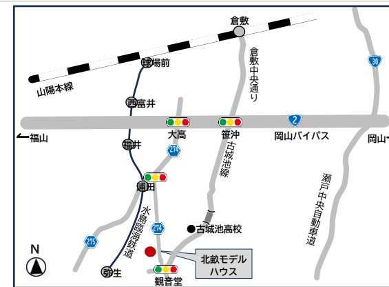
【ナビ住所】倉敷市北畝6丁目16-36