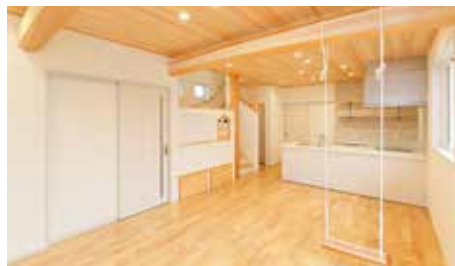
大人も楽しめるプランコのあるリビング