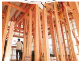
断熱材の施工前は、柱や金物、筋交いなど、どんな材料をどのように施工しているか全て確認できます