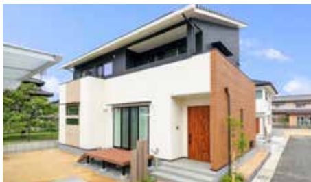
配色にもこだわったスタイリッシュな外観