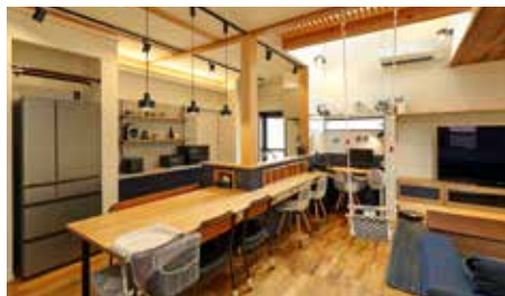
棟梁手作りの造作が随所に施された LDK