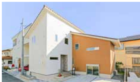
プライバシーに配慮し光を採り込む設計