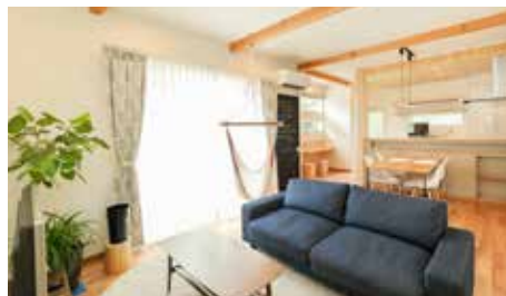
珪藻土と天然木に囲まれた LDK